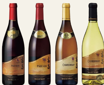
※ワイン画像はイメージです

1969年にイギリスで設立された著名な審査員によるブライントーティングと科学的な分析で選考され、「産地」「種類」「スタイル」「ヴィンテージ」など各カテゴリー別に分類され、金・銀・銅賞があたえられます。