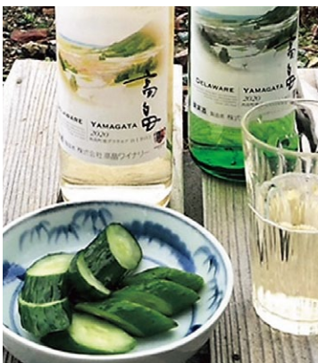
上/山形名物芋煮と新酒 下/新酒とキュウリ漬け