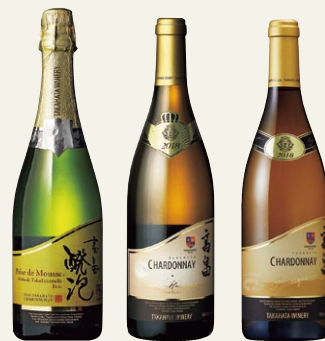
※ワイン画像はイメージです

イギリスのワイン雑誌「デキャンター」主催の世界最大の国際ワインコンテストにおいて、高島ワイナリーが国内では最多の賞を獲得。世界のワイン市場を席巻するイギリスのエディターたちにシャルドネの高島を印象付けた受賞です!